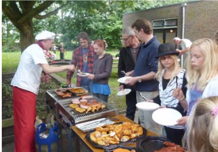
Jaarlijkse barbeque in het dorpshuis

Uit het onderzoek van de Hanzehogeschool komt naar voren dat 62% van de respondenten lid is van een vereniging. Dit gaat dan om de verenigingen zoals Dorpsbelangen, Dorpshuis, Toneelvereniging, IJvereniging, Kaart – en biljartclub. Daarnaast is ook nog ruim 30% lid van een vereniging buiten het dorp.