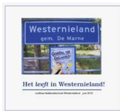
Rapport leefbaarheids- onderzoek uit 2010

De belangrijkste resultaten uit het onderzoek zijn: