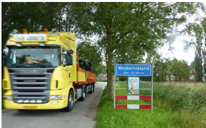
Zwaar verkeer met 50 km/u door het dorp