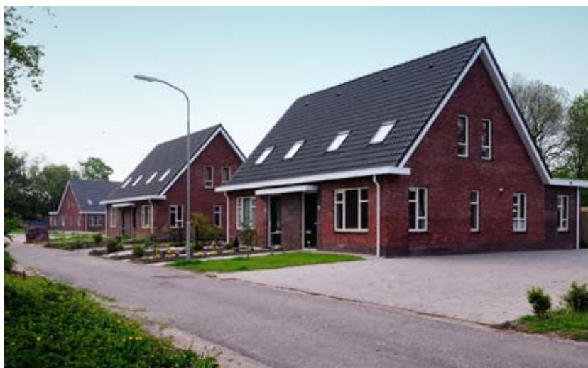
Nieuwe huurwoningen aan de Addingalaan.

Er zijn wel geluiden dat er te weinig koopwoningen (iets \leftarrow 50% van de respondenten zegt dat) en starterswoningen (72%) zijn. 12 respondenten zeggen een bouwkaavel te willen hebben in Westernieland. Gezien de krimp situatie van de gemeente zit het er echter niet in dat er door de woningstichting nog nieuwe (huur)woningen gebouwd worden in het dorp. Particulieren kunnen wel nieuwbouw of her- of verbouwplannen uitvoeren.