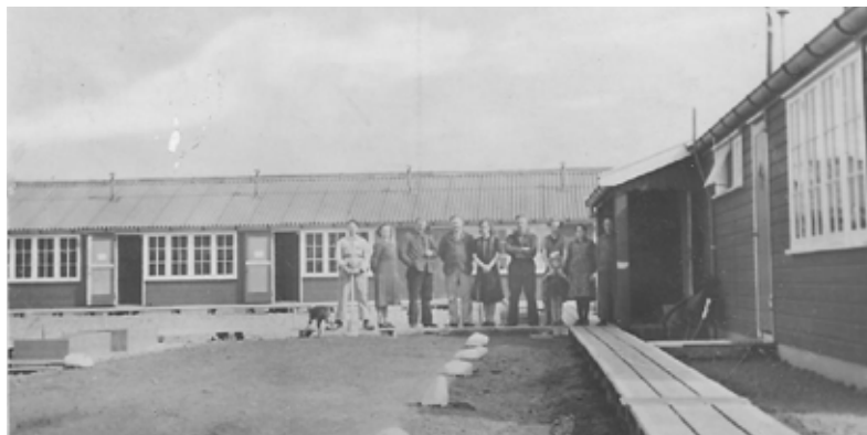
Voormalig werkkamp "de Slikken"

Tijdens de crisisjaren stonden ten noorden van Westernieland de barakken van de arbeiders die voor de werkverschaffing op de slikken werkten. Een deel van deze barakken staan er nog steeds en zijn thans bekend onder de naam "recreatieoord De Slikken".