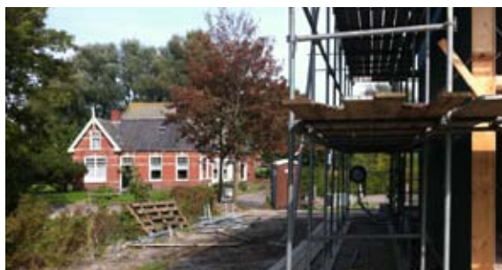
Oud- en nieuwbouw

In het kader van het project Vitale Dorpen heeft Westernieland de mogelijkheid gekregen een wens van de inwoners uit te voeren om een ontmoetingspark te creëren, waar alle bevolkingsgroepen gebruik van kunnen maken.