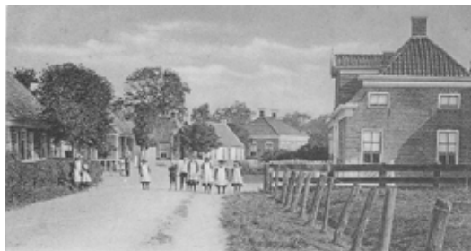
Westernieland rond 1900

Westernieland is een klein dorp in de gemeente De Marne. De gemeente omvat een 21-tal dorpen. Het dorp Westernieland dankt haar naam aan bedijking en inpoldering in de 14e eeuw: "op zee gewonnen westelijk land". De eerste bedijking vond al plaats omstreeks 1350. De omgeving van Westernieland was daarvoor reeds geruime tijd bewoond gebied. De kerk stamt uit omstreeks 1300 en ook enkele namen van boerderijen zijn sindsdien bekend. Voor de reformatie (1584) heette Westernieland "Mariaburen" en daarna Nijlant. Bij Oldenzijl lag ook een dorpje Nijlant en zo onstonden de namen Westernieland en Oosternieland.