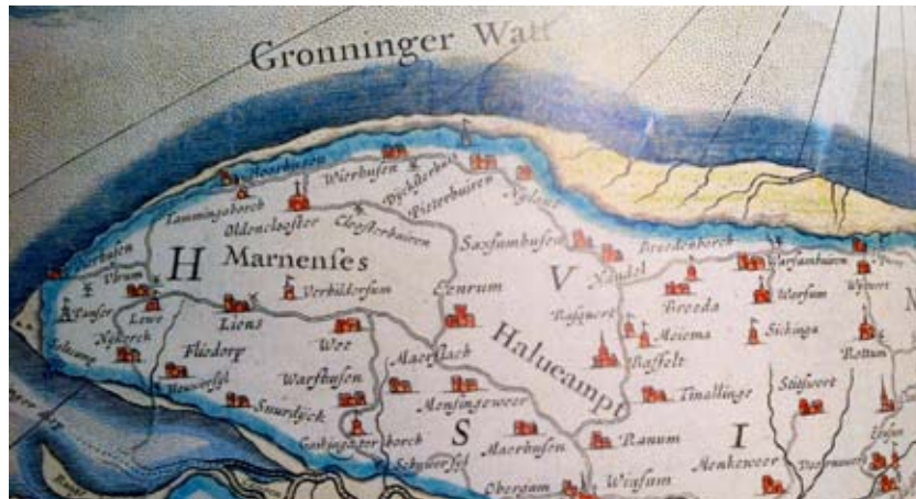
de Marne, circa 1650

Westernieland is een klein dorp in de gemeente De Marne. De gemeente omvat een 21-tal dorpen. Het dorp Westernieland dankt haar naam aan bedijking en inpoldering in de 14e eeuw: "op zee gewonnen westelijk land". De eerste bedijking vond al plaats omstreeks 1350. De omgeving van Westernieland was daarvoor reeds geruime tijd bewoond gebied. De kerk stamt uit omstreeks 1300 en ook enkele namen van boerderijen zijn sindsdien bekend. Voor de reformatie (1584) heette Westernieland "Mariaburen" en daarna Nijlant. Bij Oldenzijl lag ook een dorpje Nijlant en zo onstonden de namen Westernieland en Oosternieland.