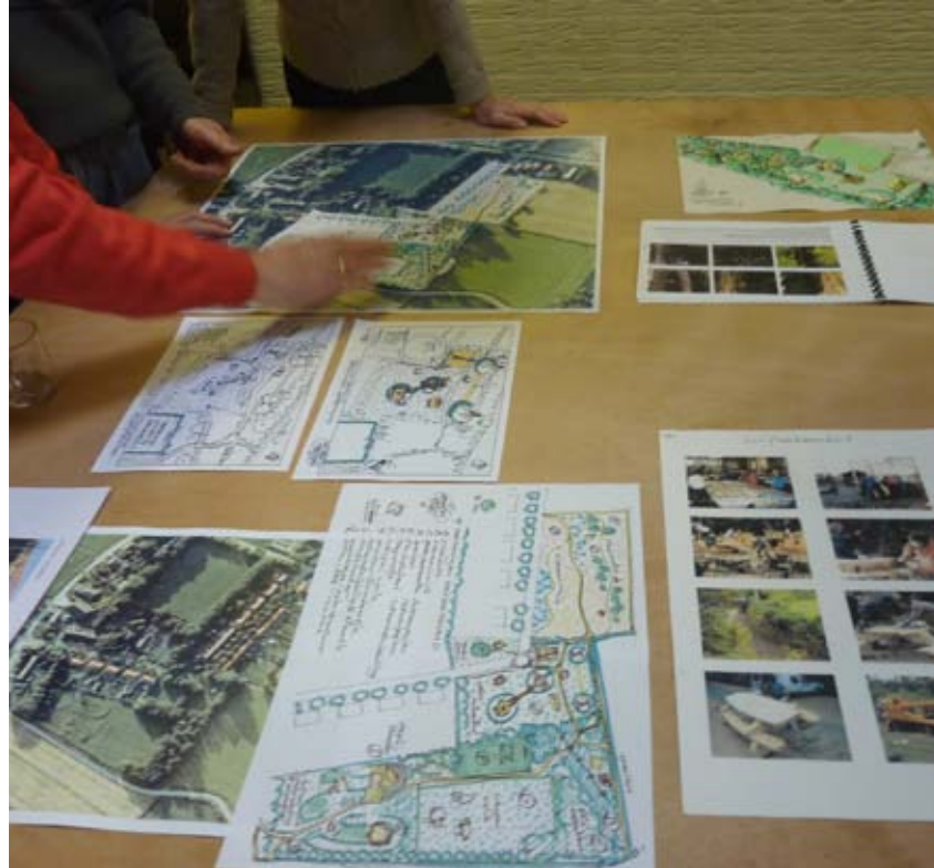
Schetsen voor de nieuwe speeltuin en Addingapark oktober 2012

Een werkgroep Speeltuin werkt het speeltuinproject uit. Het speeltuinplan en de stand van zaken werd op de thema avond van 20 februari aan de aanwezigen voorgelegd. Subsidies worden aangevraagd voor de verschillende speeltoestellen. Zodra deze toegewezen zijn, kan met de uitvoering worden begonnen.