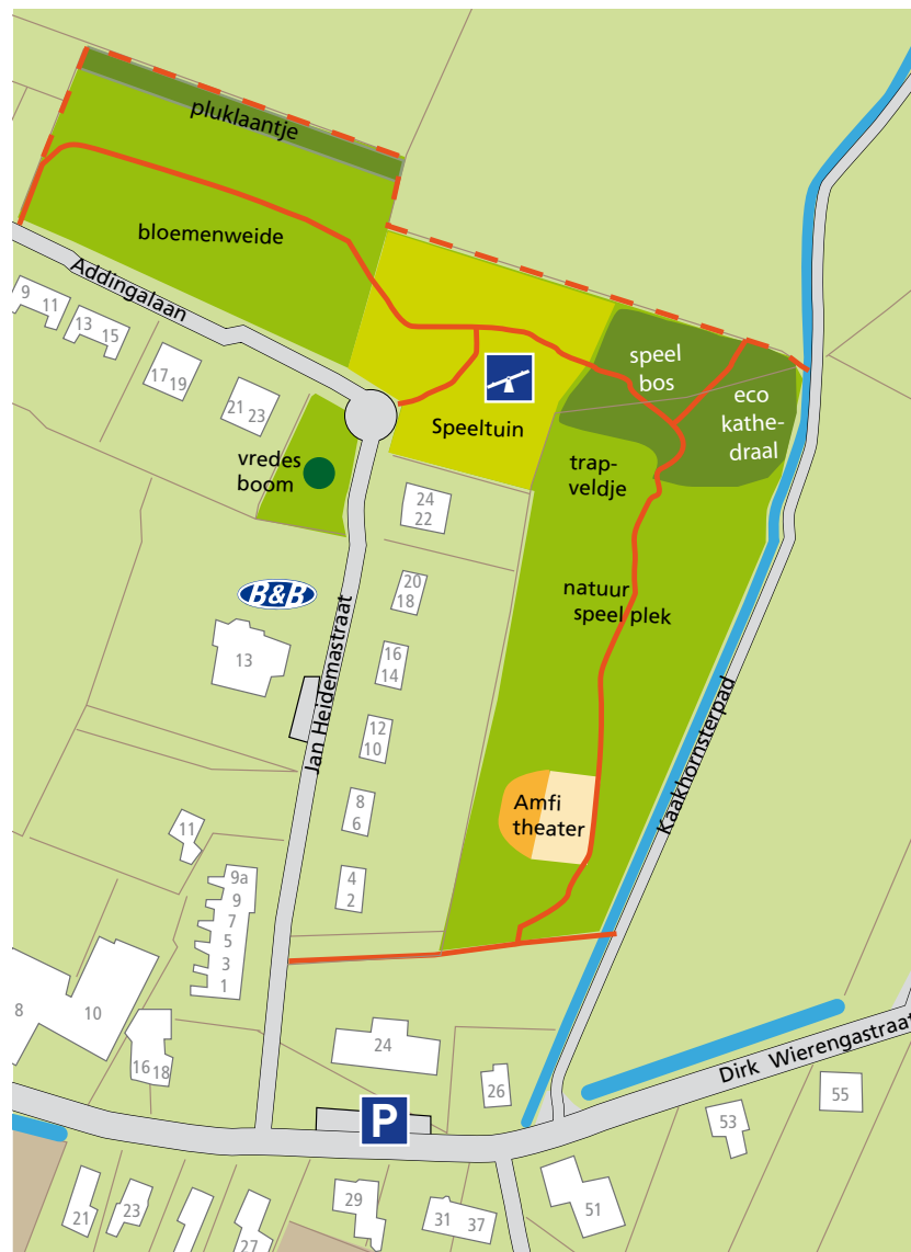
Projectplan Addingapark en nieuwe speeltuin september 2012