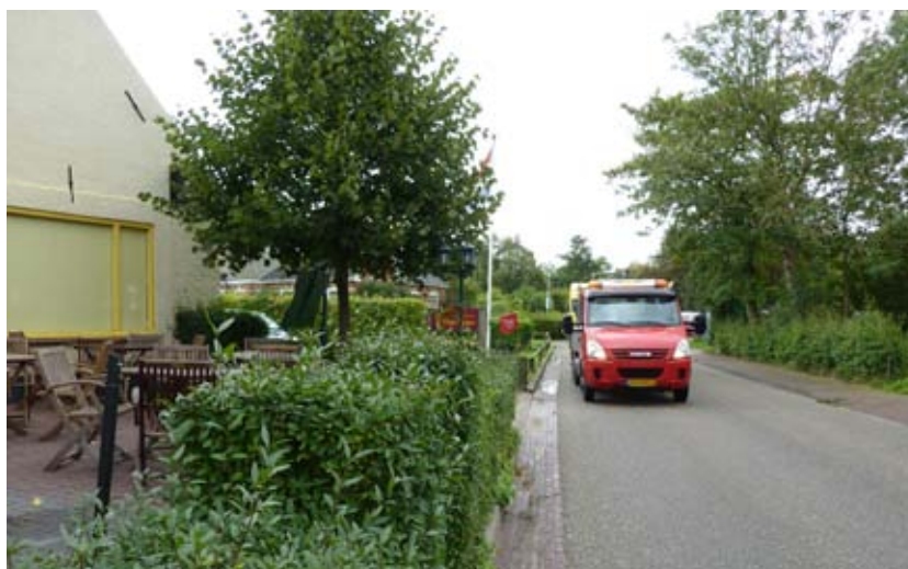
Verkeer rijdt met 50 km/u vlak langs de huizen

Deze discussiepunten zijn voortgekomen uit de resultaten van het onderzoek van de Hanzehogeschool.